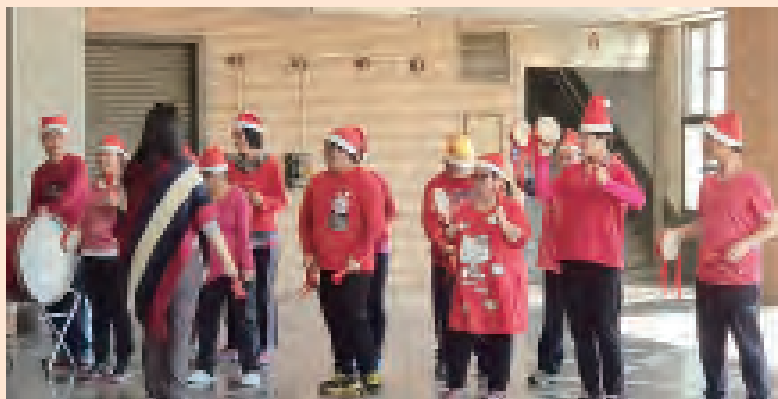
▲院生們演奏打擊樂，向同學們報佳音。