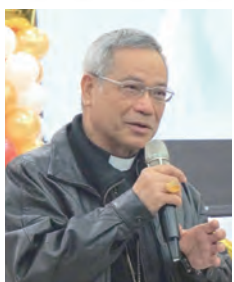
▲洪山川總主教勉勵奉獻生活者定要時時喜樂！