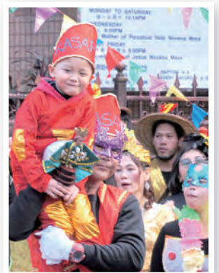
▲真人版小耶穌相當搶鏡頭