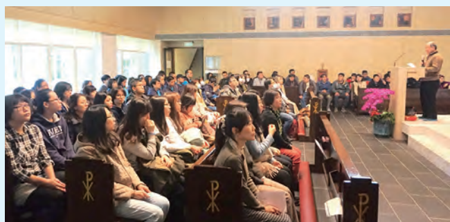
▲逾百人齊聚公署聖堂，同心追思大家心目中的欣悅天使。

讓我們把握活著的每一天，勇於向身邊的近人道愛，那時我們將沒有遺憾，如同燦爛如光的欣悅。