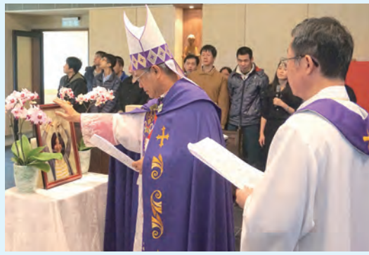
▲洪山川總主教輕撫欣悅遺照，給予誠摯降福。