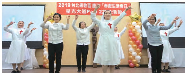
▲聖嘉民靈醫修女會以活潑的載歌載舞，與全場同歡。 ▼義大利籍的3位聖嘉祿兄弟會士，美聲動人。 ▼奧斯定修女會〈燭光舞〉輕柔曼妙