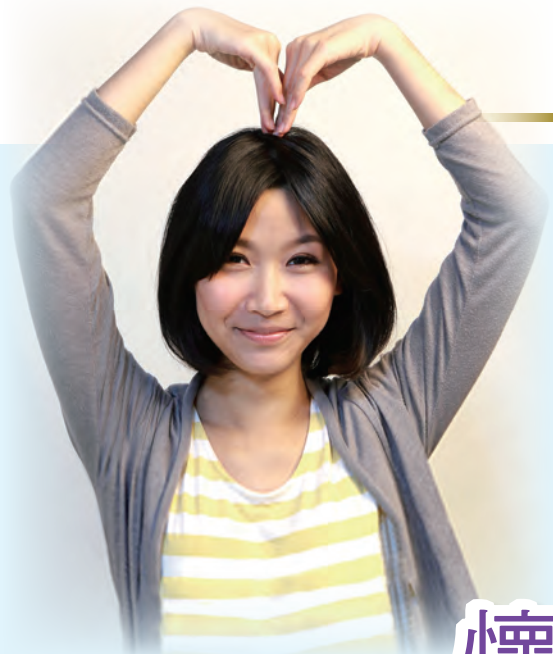
▲欣悅的音容笑貌永遠活在大家心裡，她的愛，芳澤長流。（家屬提供）