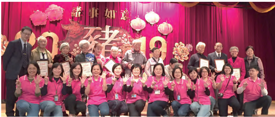
▲至善頒發證書給住滿15年的長輩們，工作人員（前排）一起合影同慶。

在回顧至善15周年的影片中，多少過往的照片歷歷在目，配合老歌及聖歌的旋律，也幫長者做了很好的生命回顧，一起共賀至善15周年快樂！