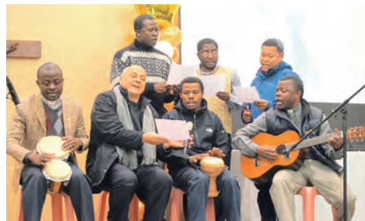
▲不同修會的神父及修士們即興演出，非洲風十足。