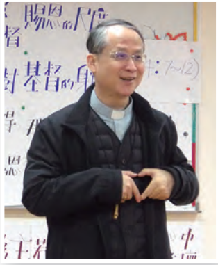
▲李克勉主教期勉同仁們「同道偕行」，建構愛的教會。

新春開工，新竹教區主教公署於2月11日於公署3樓會議室舉行春節團拜祈福活動，李克勉主教與劉丹桂主教帶領全體員工，以「同道偕行」為主題，祈福團聚，為新的一年領受天主的降福，以滿被的祝福開始新年第1天的工作。