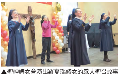
▲聖神婢女會演出羅麥瑞修女的感人聖召故事