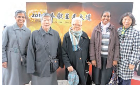
▲來自各國的修女們在星光大道看板前歡喜留影