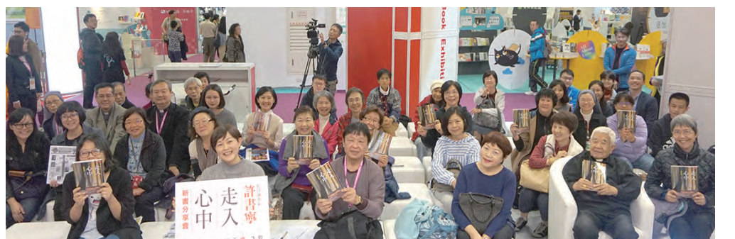
▲《走入心中——避靜的好處》分享會，吸引許多教外朋友詢問天主教的避靜為何？教友把握機會作福傳。