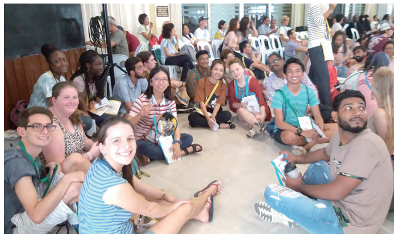
▲與世界各地來的教會青年共度大谷地的五天體驗營

教宗在世青的影片中也提到聖母：「天主給我們的計畫，和給聖母的，沒有什麼不同：不是為了熄滅夢想，而是為了點燃渴望，使我們的生命真的有收穫，使許多人微笑，使人心喜樂。」聖母對天主那樣慷慨的一句「爾旨承行」，永遠地改變了人類的歷史。