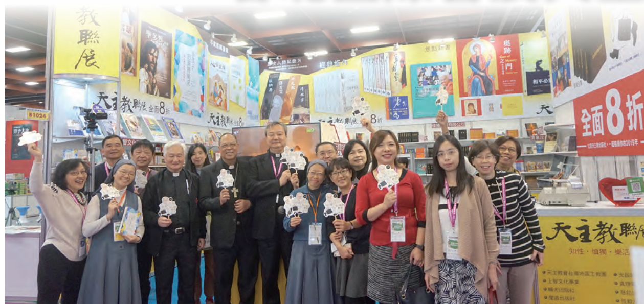
▲參與天主教聯展的各出版單位工作人員，在書展期間展開熱切福傳，介紹好書及影音出版品，引人認識天主教信仰的美好。

為了讓展出視聽俱佳，此次展場的設計也委請輔大支持，以梵蒂岡國旗的黃色和白色為展場基調，加上各出版社的新書或視聽新作大圍繞整場，讓展場氣勢格外亮眼。11日下午參展的12家出版品工作人員更