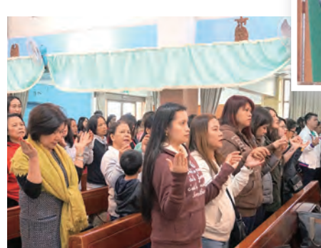
▲手牽著手誦唱〈天主經〉是菲律賓的傳統禮儀