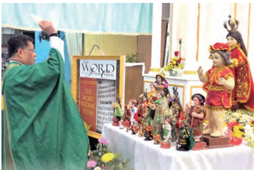
▲主禮神父為所有耶穌聖嬰態像灑聖水祝福