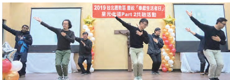
▲鮑思高慈幼會修士們熱舞演出和諧默契，傳遞年輕人蓬勃朝氣。 ▼洪山川總主教頒贈禮物給節目表演單位，感謝大家的認真演出。