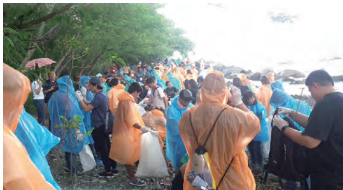
▲響應教宗方濟各的《願祢受讚頌》環保通諭呼籲，大家同心淨灘。 ▶菲律賓馬尼拉世貿的活動場外，來自世界各國的年輕人相見歡。

回來後，大家會與全球的年輕人一起持續投入「合一世界途徑」計畫，並相約邀請更多人參加下一屆在巴西舉行的新青節。