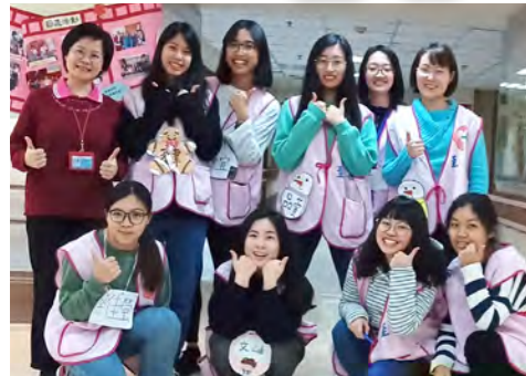
▲輔大同學的服務活力有愛