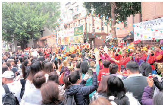
▲台北聖多福天主堂前歡慶耶穌聖嬰節，萬頭攢動，盛況空前。