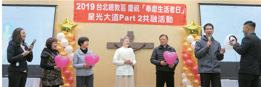
▲在牧靈福傳處設計的滾球活動中拿到愛心氣球的神長、修女及平信徒，上台接受趣味挑戰。

台北總教區主教、神父和修女在2月1日下午於台灣總修院歡度奉獻生活者日「星光大道Part 2」的共融。大家長洪山川總主教勉勵與會者與「負傷者」相遇，才能自癒人癒，度奉獻生活者更要時時生活在喜樂中，才能讓人看見耶穌，追隨基督。