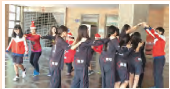
▲同學們開心地陪伴院生玩遊戲

經過這次的陪伴經驗，我發現院生們雖然身心上有些障礙，在日常生活中很辛苦，但他們很認真努力的態度，非常值得我們學習。我想，如果還有下次，我願意以愛和包容來陪伴他們，多體諒他們的行為，多和他們說話，多陪在他們旁邊。更專心聆聽他們的心聲，學習從他們的角度去思考他們想要的是什麼並從此角度去幫忙，認真理解他們想表達