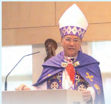
▲光仁痛失英才，洪山川總主教以天主教的生死觀撫慰哀慟的心。