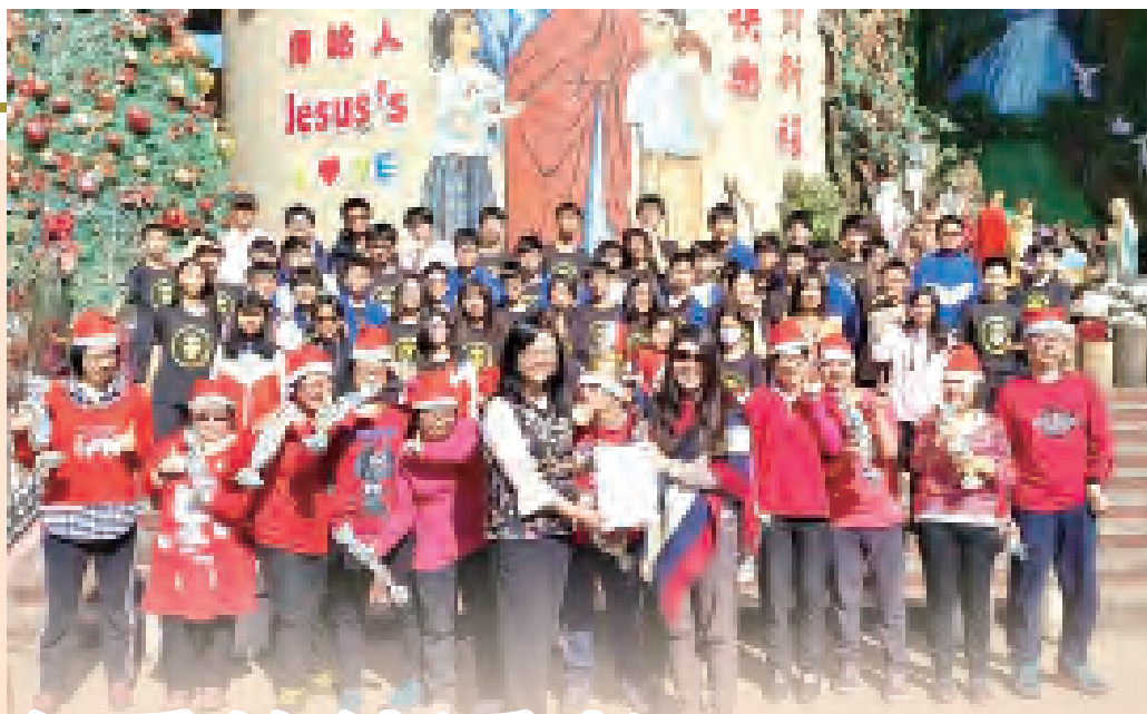
▲校長與國二15班同學們一起歡迎慈愛智能發展中心院生。