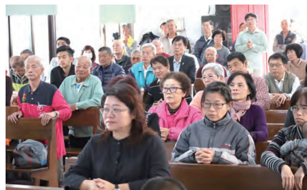
▲全體參禮者虔誠朝拜聖體

徐神父說：「今天是9月大敬禮的最後一站，主題為『福傳』，祈禱意向特別為教會祈禱。由《聖經》記載中我們知道，耶穌升天前吩咐宗徒們，要往普天下去，向一切受造物宣傳福音，因著這項命令，教會就成為傳教使命的團體，每位基督徒在領洗時也領受這一個使命。保祿宗徒說：『我若不傳福音，我就有禍了。』（格前9:16）這不但是因為教會是一個負有傳教使命的團體，更重要的是所有基督徒都是福傳者。因為『我生活已不是我生活，而是基督在我內