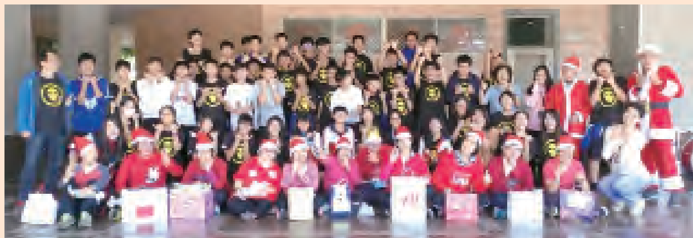
▲活動結束時，大家一起拍個團體照，並互祝健康快樂。

雖然，之前參加過柬埔寨國際志工的服務、國際志工社團活動……但有規畫性的當主持人的體驗，還真是第1次，能夠有機會接觸活動，使我感到開心。透過這次的活動，我得到了許多以前沒有的難忘經驗，很感謝參與本次活動的老師、同學們，相信每個人都得到了不少的收穫，「個人不要單顧自己的事，也要顧及別人的事。」世上還有很多的人，需要我們的幫助呢！幫助他人真的能使自己變得快樂噢！也期盼大家能有著一顆助人之心。